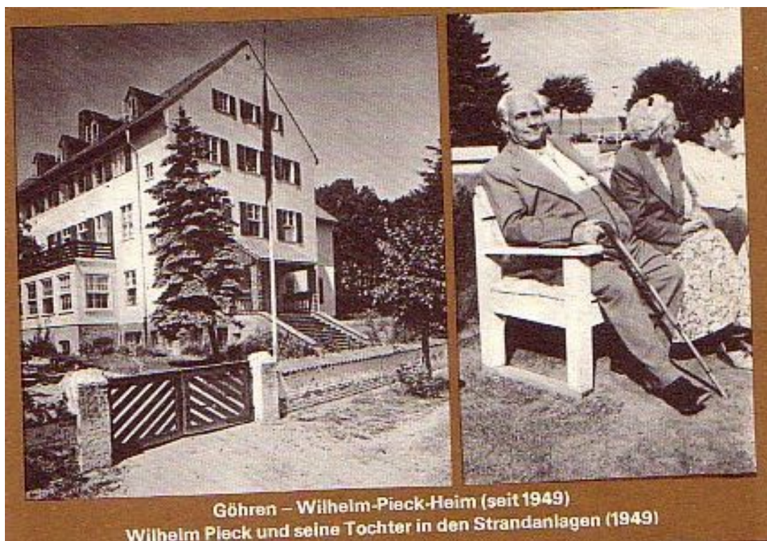
Präsident Pieck in Göhren