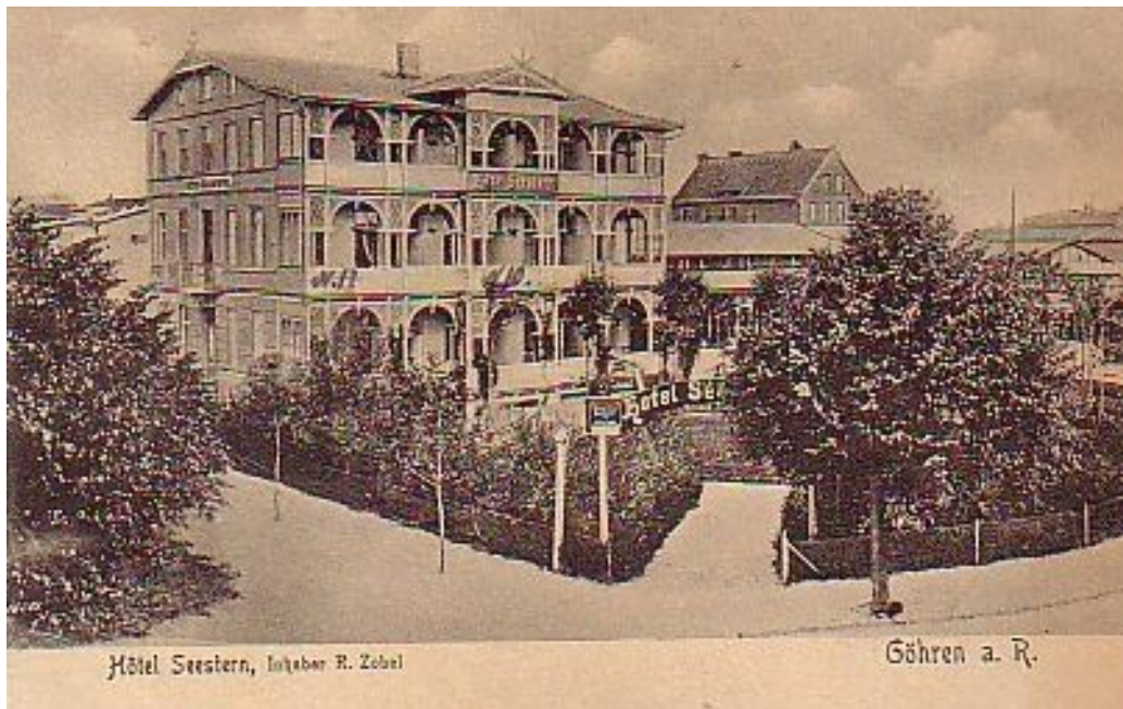
Hotel Seestern Zobel 1900 - 1923