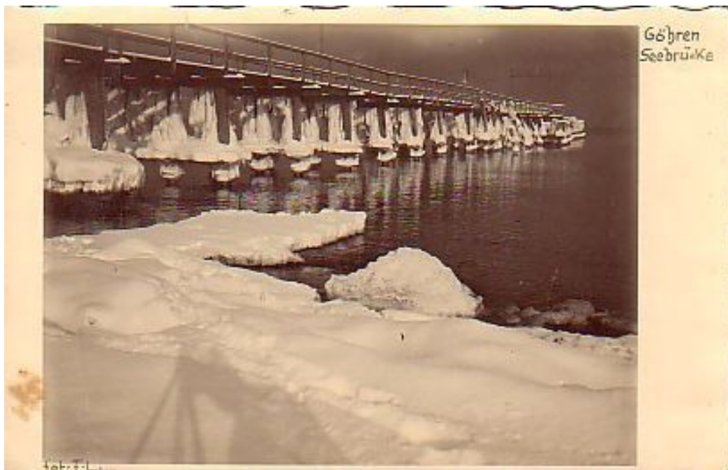
Seebrücke Göhren um 1950