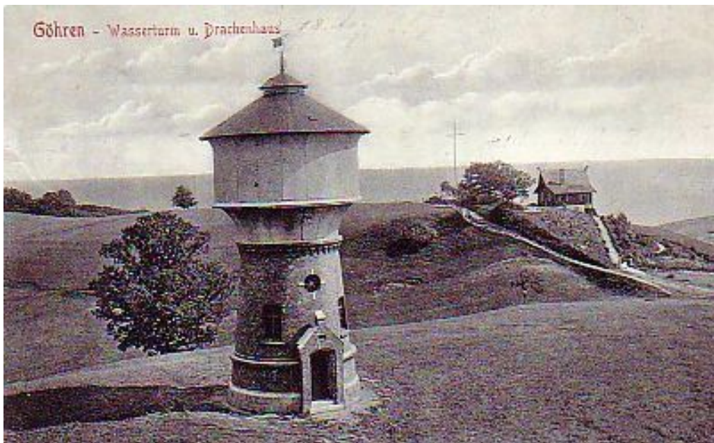
Wasserturm Göhren 1912