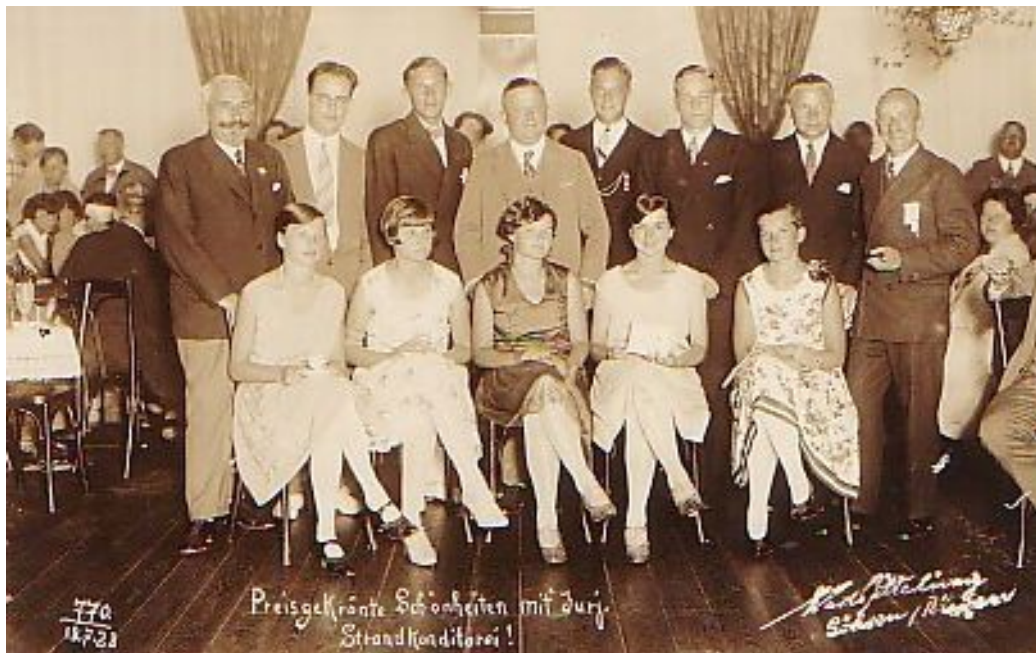
Strandcafé Göhren 1928